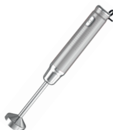
Hand Blender AD 4617