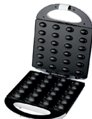
Nut Cookie Maker AD 3039