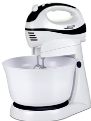
Mixer w/rotating bowl AD 4206