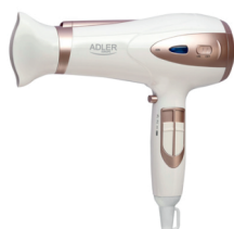
Ionic Hair Dryer AD 2248