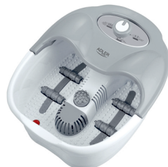
Foot Spa AD 2167