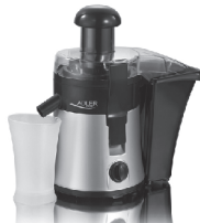
Juice Extractor AD 4106