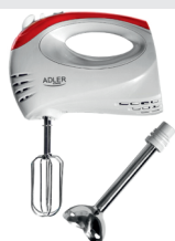
Mixer with blending shaft AD 4212