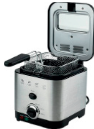
Deep Fryer AD 4911