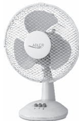
Table Fan AD 7302