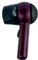
Travel Hair Dryer AD 2247