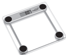
Bathroom Scale AD 8121