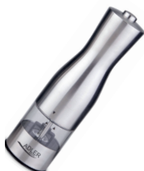
Pepper mill AD 4434