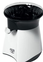
Citrus Juicer AD 4005