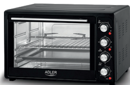
Electric Oven AD 6010