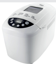
Bread Maker AD 6019