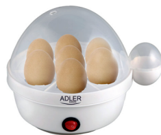
Egg Boiler AD 4459