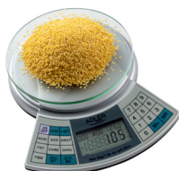
Diet Kitech Scale AD 3133