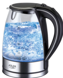
Electric kettle AD 1225