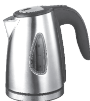
Kettle AD 1203