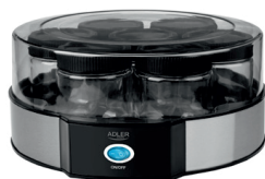
Yogurt Maker AD 4476