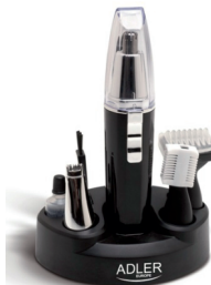
Trimmer AD 2907