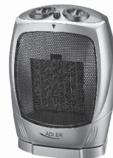
Fan Heater AD 7703