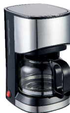
Dripp Coffe Maker AD4407