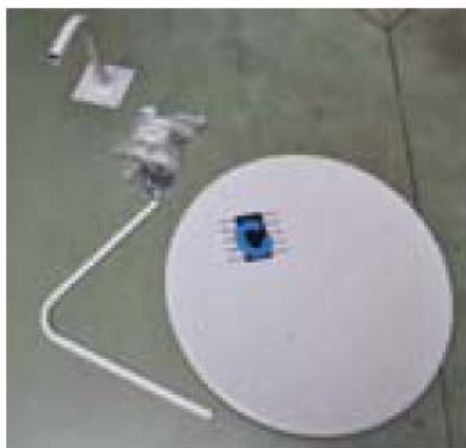
1. Șuruburi și piulițe de montare 2. Dibluri (opțional)