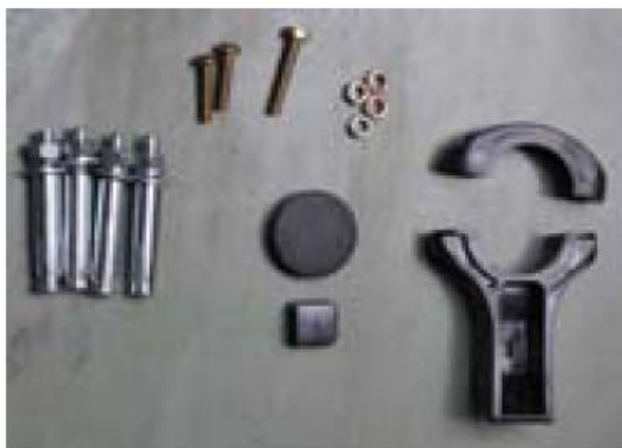
3. Capace de fixare 4. Cleme montaj consola LNB