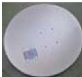
7. Antena satelit (parabola)