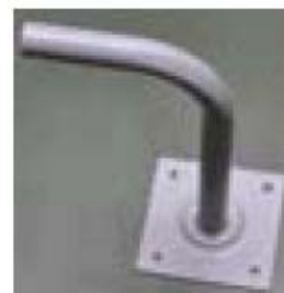
8. Suport montare pe perete (opțional numai pentru ANT0044, ANT0045, ANT0046)