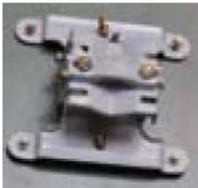
5. Suport reglabil parabola