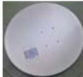
7. Antena satelit (parabola)