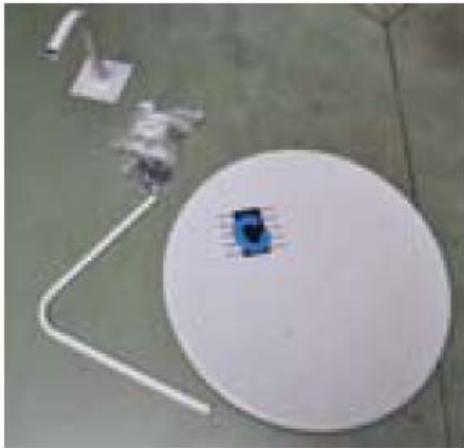
1. Șuruburi și piulițe de montare 2. Dibluri (opțional)