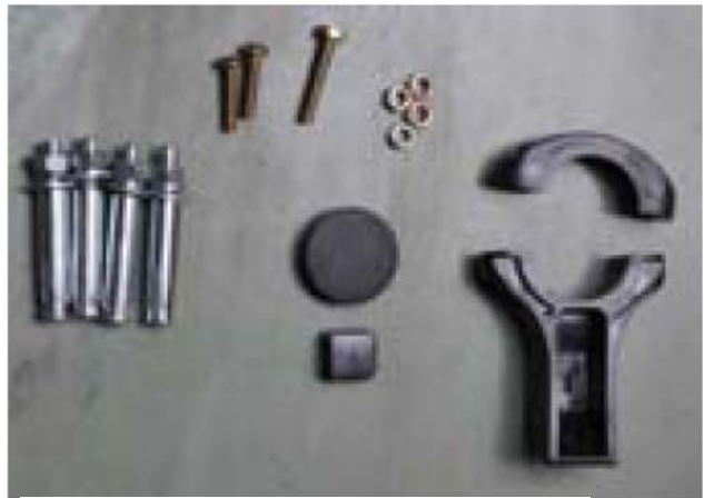
3. Capace de fixare 4. Cleme montaj consola LNB