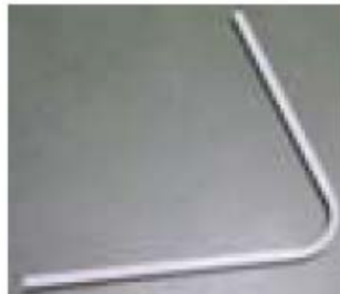
6. Rama convertor LNB