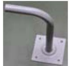
8. Suport montare pe perete (opțional numai pentru ANT0044, ANT0045, ANT0046)