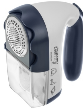
Lint remover CR 9606