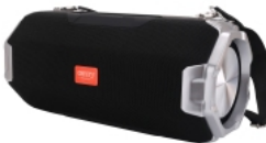
Bluetooth Speaker CR 1170