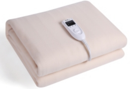
Electric Blanket CR 7407