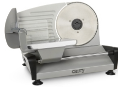
Food Slicer CR 4702