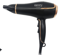
Hair Dryer CR 2255