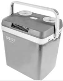
Portable Cooler CR 93