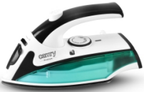
Travel Iron CR 5024