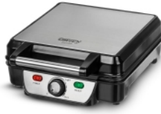
Waffle maker CR 3025