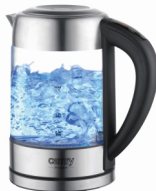
Kettle with temp. control CR 1289