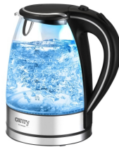
Electric Kettle CR 1239