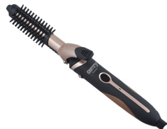
Hair styler set CR 2024