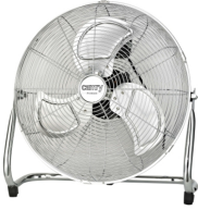
Velocity Fan CR 7306